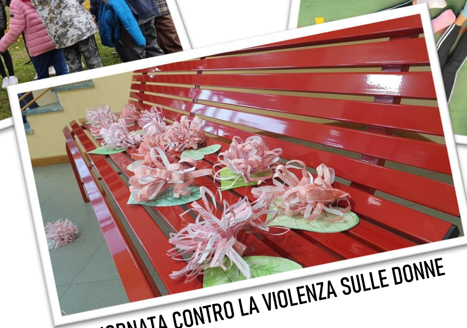
GIORNATA CONTRO LA VIOLENZA SULLE DONNE