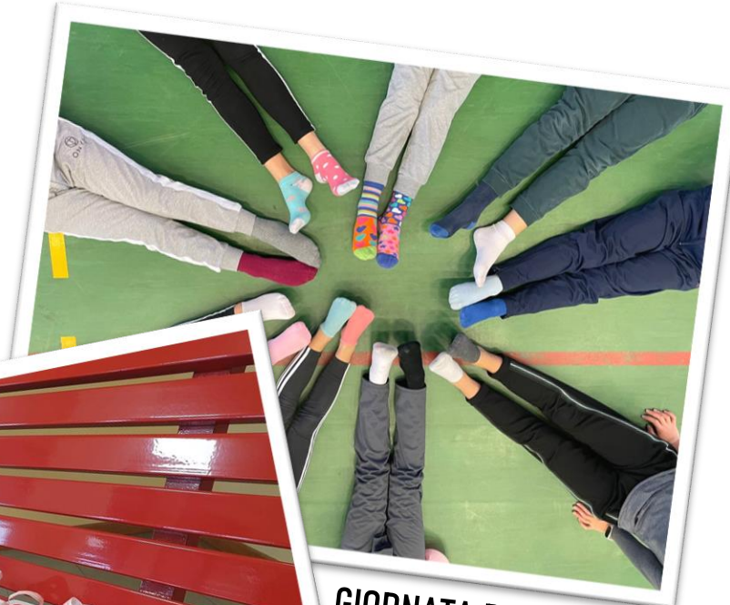
GIORNATA DEI CALZINI SPAIATI